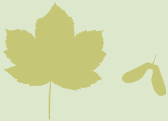
Bergahorn ( Acer pseudoplatanus )