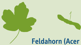
Feldahorn ( Acer campestre )