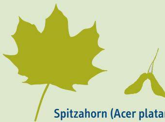
Spitzahorn ( Acer platanoides )