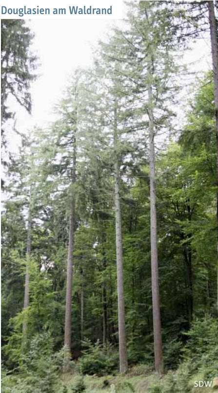
Douglasien am Waldrand

die in jungen Jahren olivgrün aussieht und mit Harzblasen übersät ist, bekommt im Alter einen sehr dunklen rotbraunen bis grauschwarzen Farbton und tiefe Risse. Die zwei bis drei Zentimeter langen, weichen Nadeln sind stumpf und besitzen auf der Unterseite zwei weiße Streifen. Werden sie zerrieben, lässt sich ein aromatischer Geruch wahrnehmen, der an Orangen erinnert. Die Douglasie ist fachlich ausgedrückt „einhäusig getrenntgeschlechtig“, was bedeutet, dass sowohl weibliche als auch männliche Blüten auf einem Baum vorkommen. Sie blüht zwischen April und Mai. Die fünf bis acht Zentimeter langen, eierförmigen Zapfen des Baumes, die zum Boden zeigen, fallen durch ihre weit herausragenden dreispitzigen Deckschuppen auf. Die fünf bis sechs Millimeter langen Flügelsamen, die bis September reifen, fliegen von Oktober bis November durch die Landschaft.